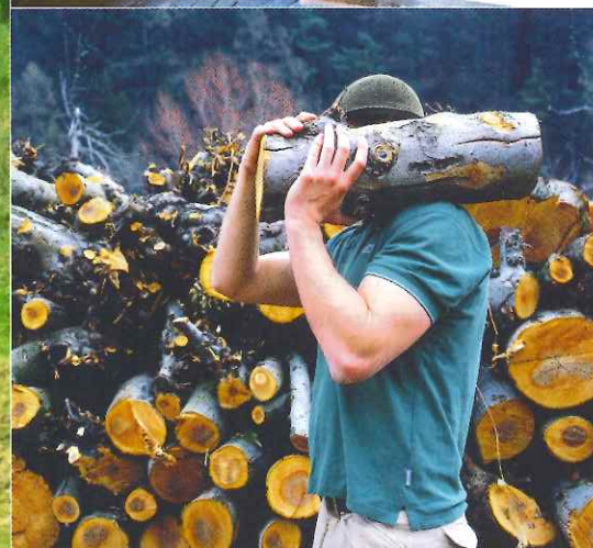
Testimone della radici nella storia di questa terra, il legno è qui la materia prima per eccellenza.